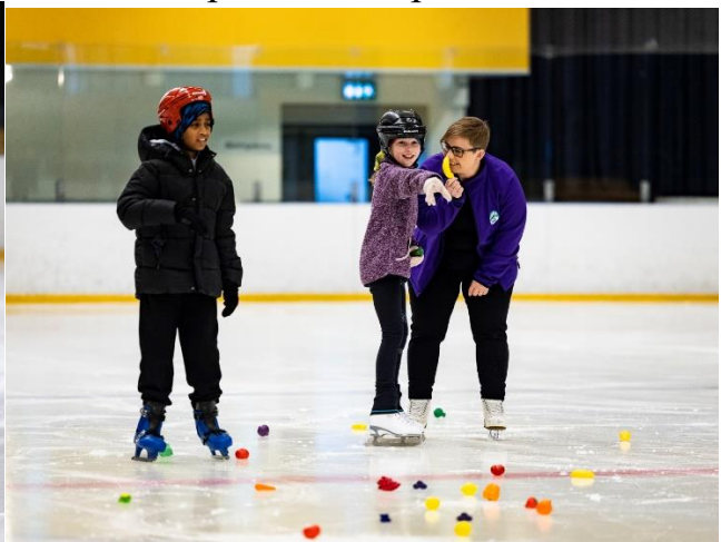
Frábær hópur skautar Aspar á góðri stundu.