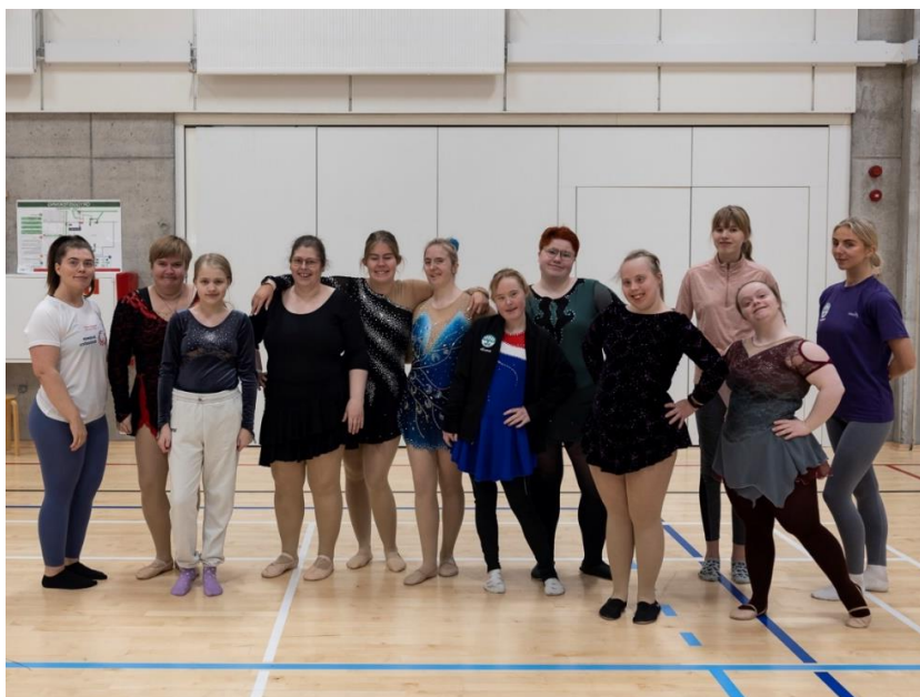
Flottir iðkendur Aspar í nútímafimleikum