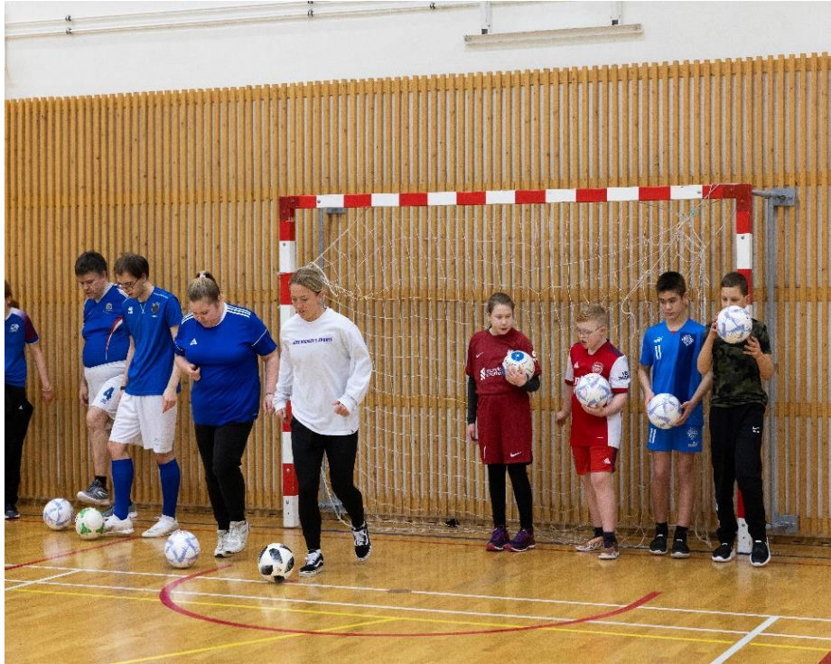
Frá æfingu í fótbolta