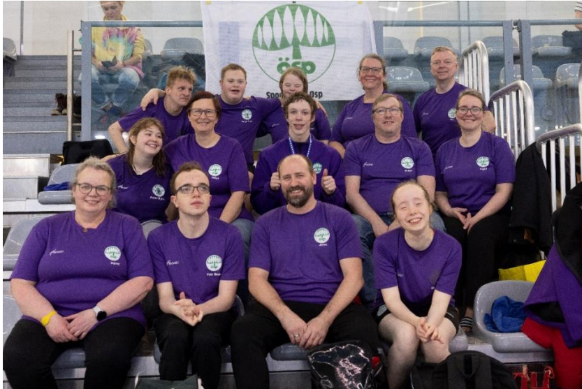
Hluti sundhópsins í Laugardal ásamt foreldrum og þjálfurum