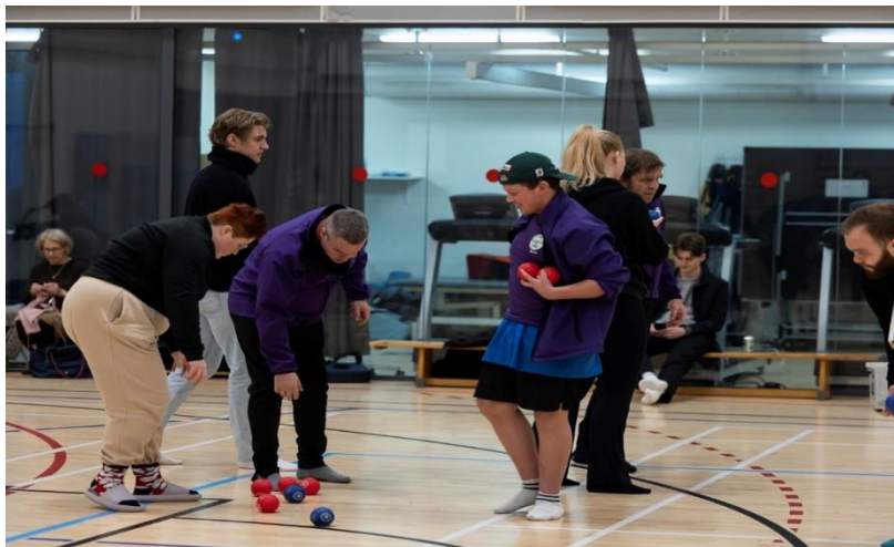
Frá æfingu í bocca í Klettaskóla

Því miður náðist ekki að taka þátt í Fjarðarmótinu að þessu sinni en það bætist vonandi úr því 2023.