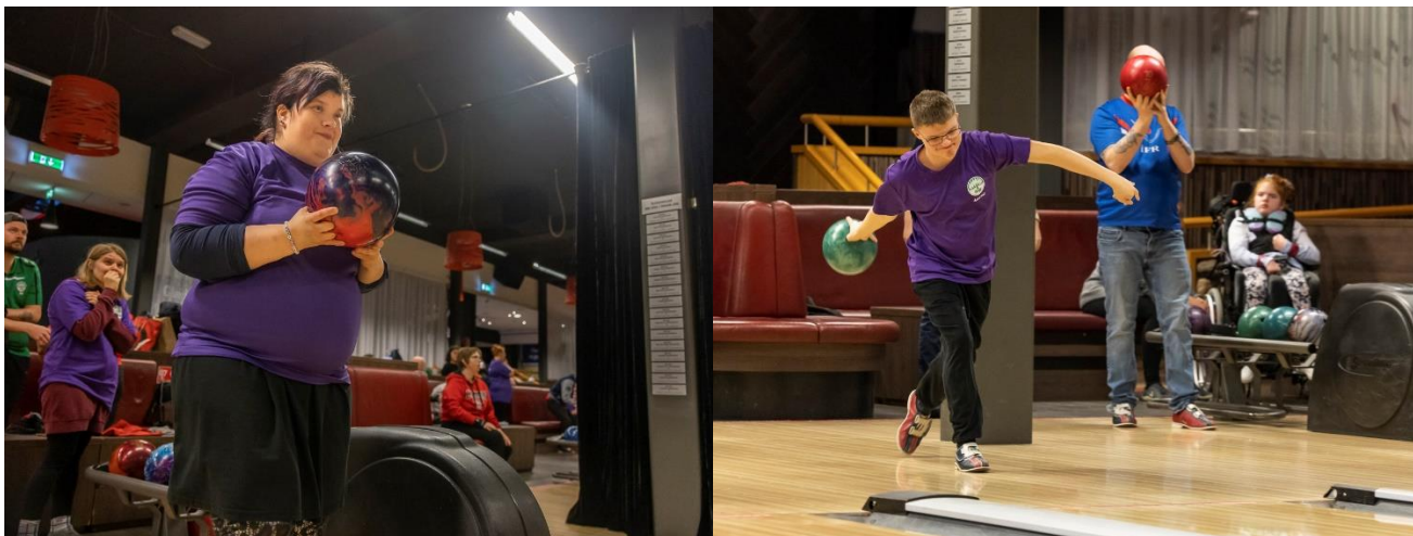
Frá keiluæfingu í Egilshöll.

sem skautarar Aspar nældu sér í ófá verðlaun og voru landinu til mikils sóma. 14. desember var svo komið að stórglæsilegri jólasýningu Aspar þar sem þemað var uppáhalds jólalögin okkar og sýndu iðkendur Aspar flottan árangur og alla framfarir hópsins og sást vel hversu frábæran hóp við höfum af hæfileikaríkum þjálfurum undir dyggri stjórn Helgu Olsen yfirþjálfara.