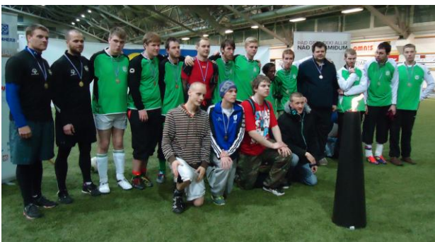
Fyrsta og annað sætið Asparlið í getumeiri flokknum í getuminni í þriðja sæti.