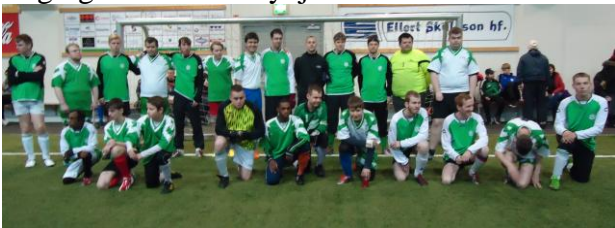
Fjögur fotboltalið Aspar.

Ösp sendi 4 fótboltalið á Íslandsleika SPO í Reykjaneshöllinni 10 nóvember í tveimur getuflokkum og í fyrsta skipti spiluðu með Ösp Lögreglumenn úr Reykjavík