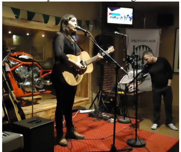
Lay Low á Tónlistarveislu Aspar