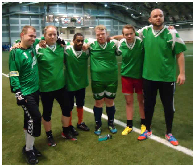
Keppendur úr Ösp og Lögreglumenn úr Reykjavík sem spiluðu með Asparliði.