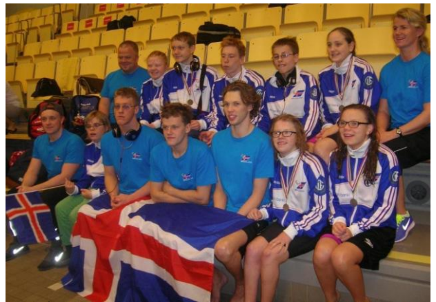
Íslenski hópurinn á NM í sundi í Svíþjóð

http://www.specialolympics.org/Sections/Donate/Special_Olympics_Torch_Run.aspx