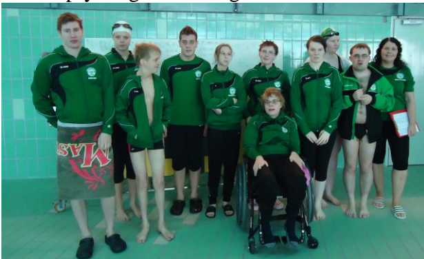
Keppendur ásamt þjálfara á Erlingsmótinu

Nóg hefur verið að gera hjá sundfólki Aspar og hafa þau verið að taka þátt í sundmótum þar hafa keppendur úr Ösp verið að standa sig með mikilli þrýði og verið félaginu til sóma